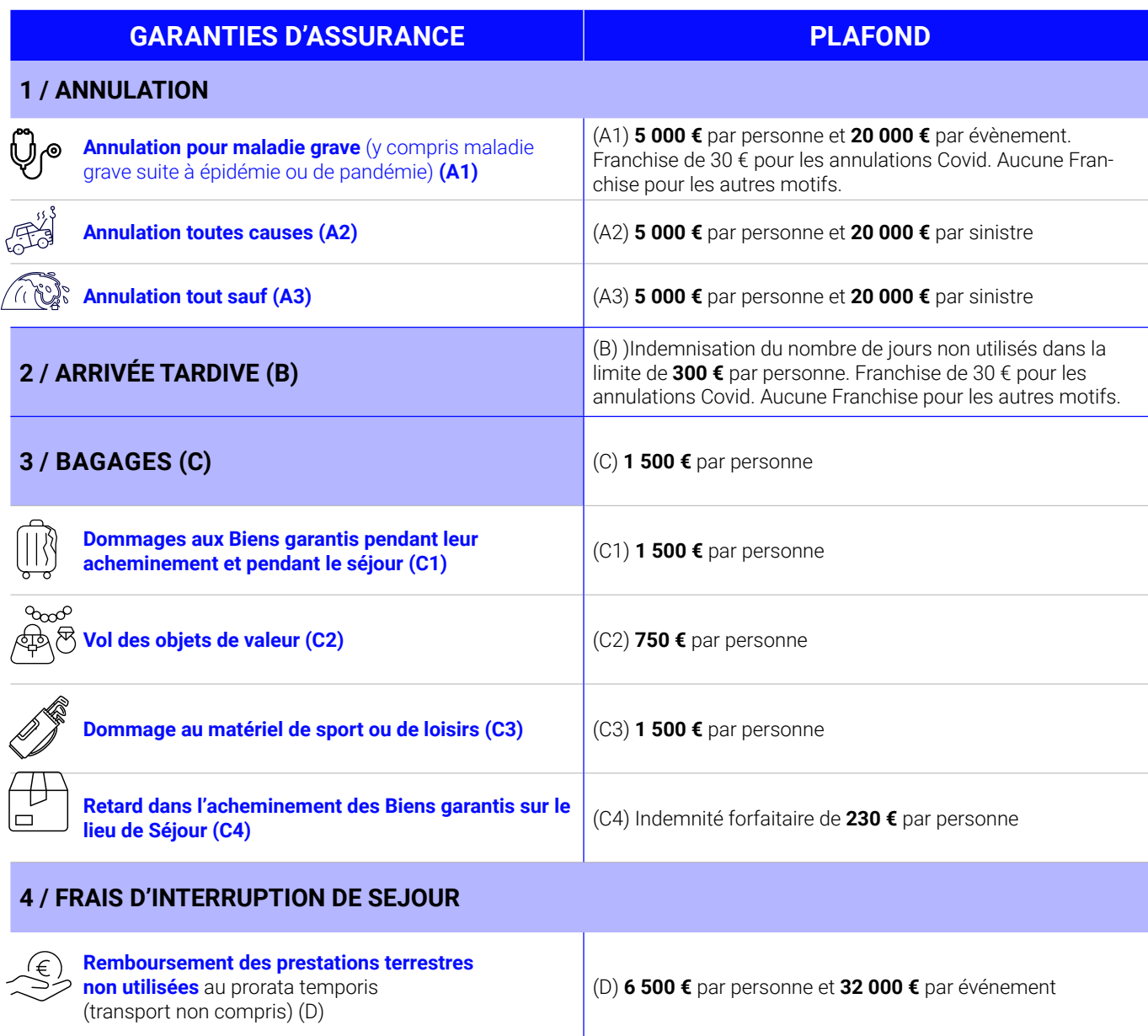
TABLEAU DE GARANTIES